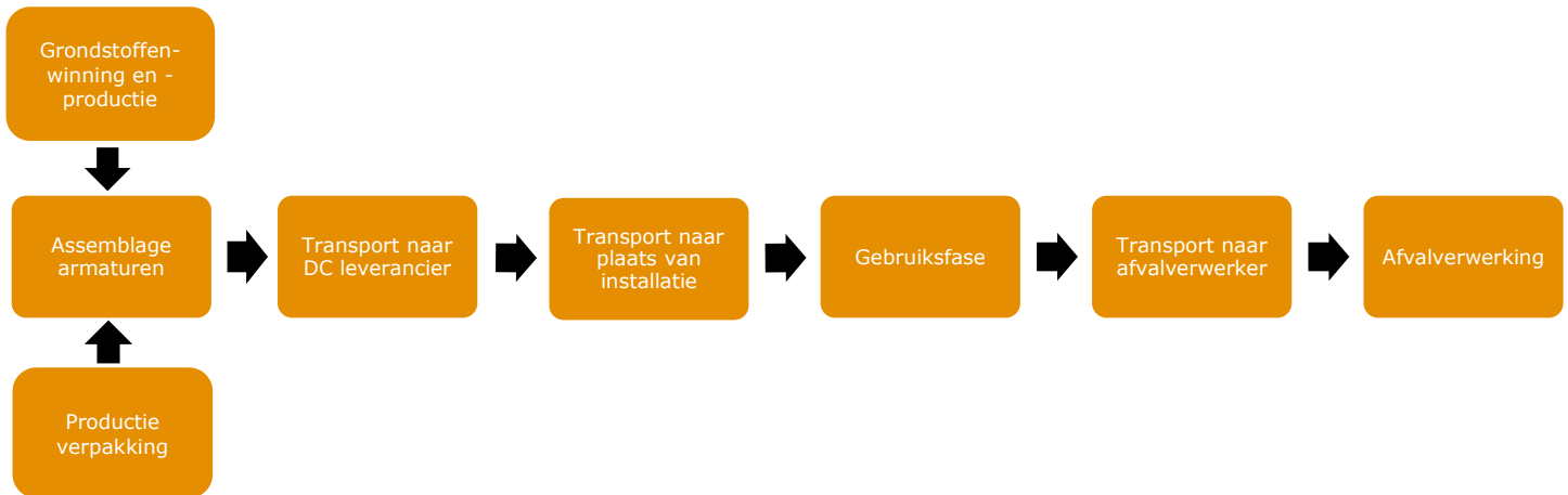
Figuur 1: Ketenstappen armaturen

De bedrijfsactiviteiten van CityTec zijn onderdeel van een keten van activiteiten. Zo moeten materialen die worden ingekocht eerst geproduceerd worden (upstream) en gaat het transporteren, gebruik en verwerken van opgeleverde "producten" of "werken" ook gepaard met energiegebruik en emissies (downstream).