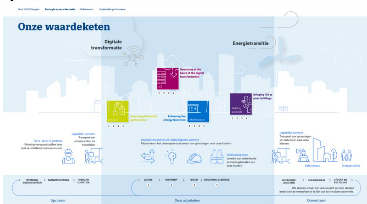
Figuur 1: Waardeketen VENL

Hoewel de waardeketen goed aansluit bij de werkzaamheden van de hele organisatie, is er voor de waardeketen voor ICT een aparte waardeketen omschreven (Figuur 2).