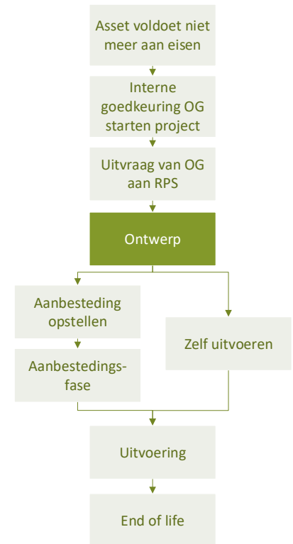
Figuur 2: Ketenstappen opdracht RPS

In de ontwerpfase kan RPS dus de meeste invloed uitoefenen. Binnen de eisen/normeringen die de opdrachtgever meegeeft in een aanbesteding heeft RPS de ruimte om het ontwerp zelfstandig in te vullen. Soms zullen er aanbestedingen zijn waarbij alle normeringen al vastgelegd en aan de andere kant ruimere uitvragen, waarbij er ontwerpvrijheid geboden wordt om verdere optimalisaties mogelijk te maken. Bij deze laatste vorm zijn er uiteraard meer mogelijkheden om CO2-reductie te behalen.